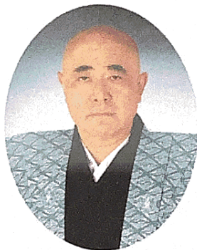
太夫 竹本千歳太夫